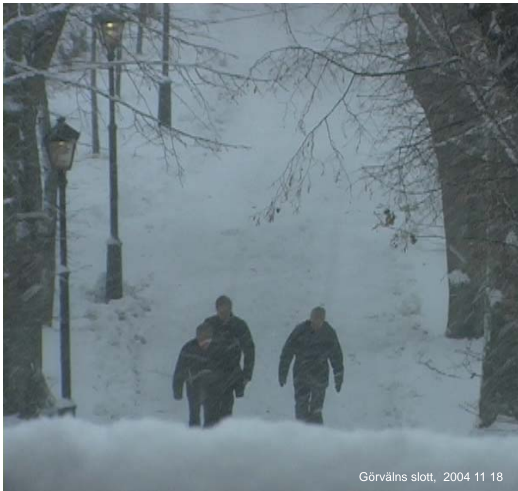
Görvälns slott, 2004 11 18

Företag inom byggnadsvård och restaurering En branschorganisation